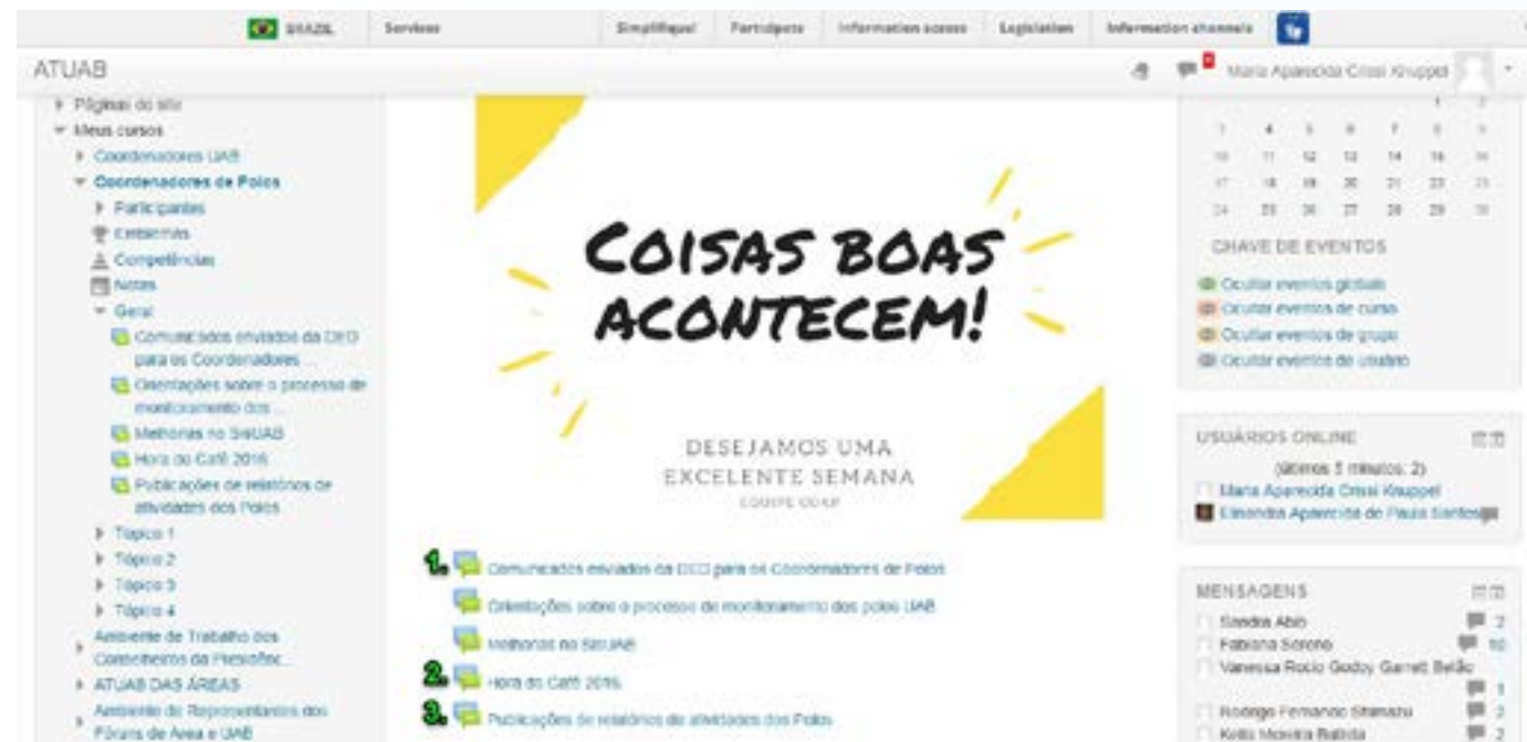
Imagem 3: Comunicados e fóruns do ATUAB