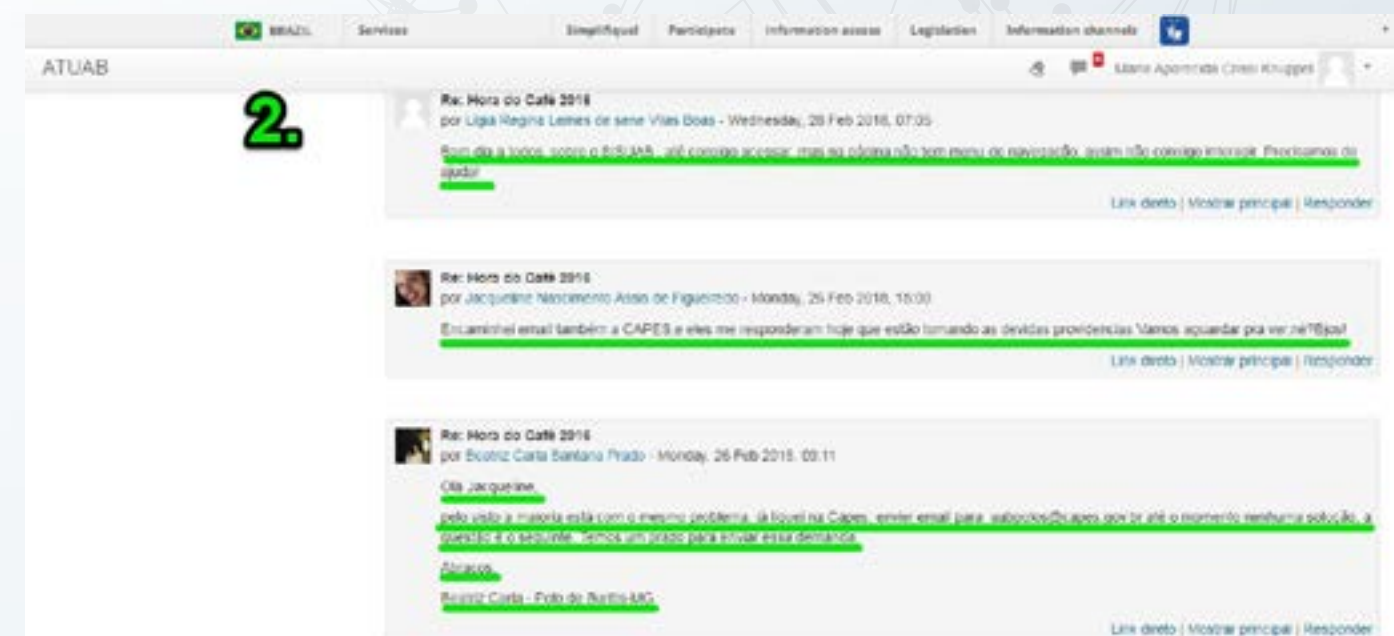
Imagem 5: Fórum Hora do Café

Agora sim, temos um espaço de comunicação e interação. Observem que tipo de publicações aparecem neste espaço: