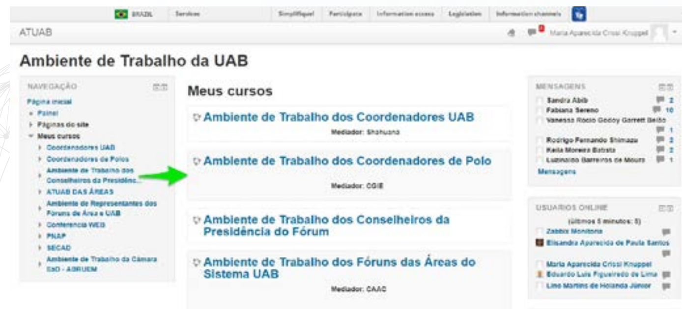
Imagem 1: Tela de acesso ao Ambiente de Trabalho dos Coordenadores de Polo – Moodle da CAPES

Sua participação no ATUAB é fundamental para que as demandas da gestão da UAB em seu Polo sejam consideradas e acompanhadas no panorama nacional em relação a modalidade.