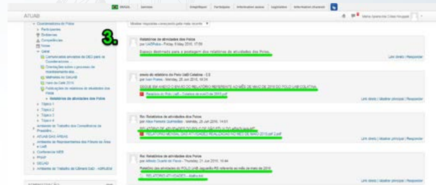
Imagem 6: Espaço de publicação de relatórios mensais de ações do Polo