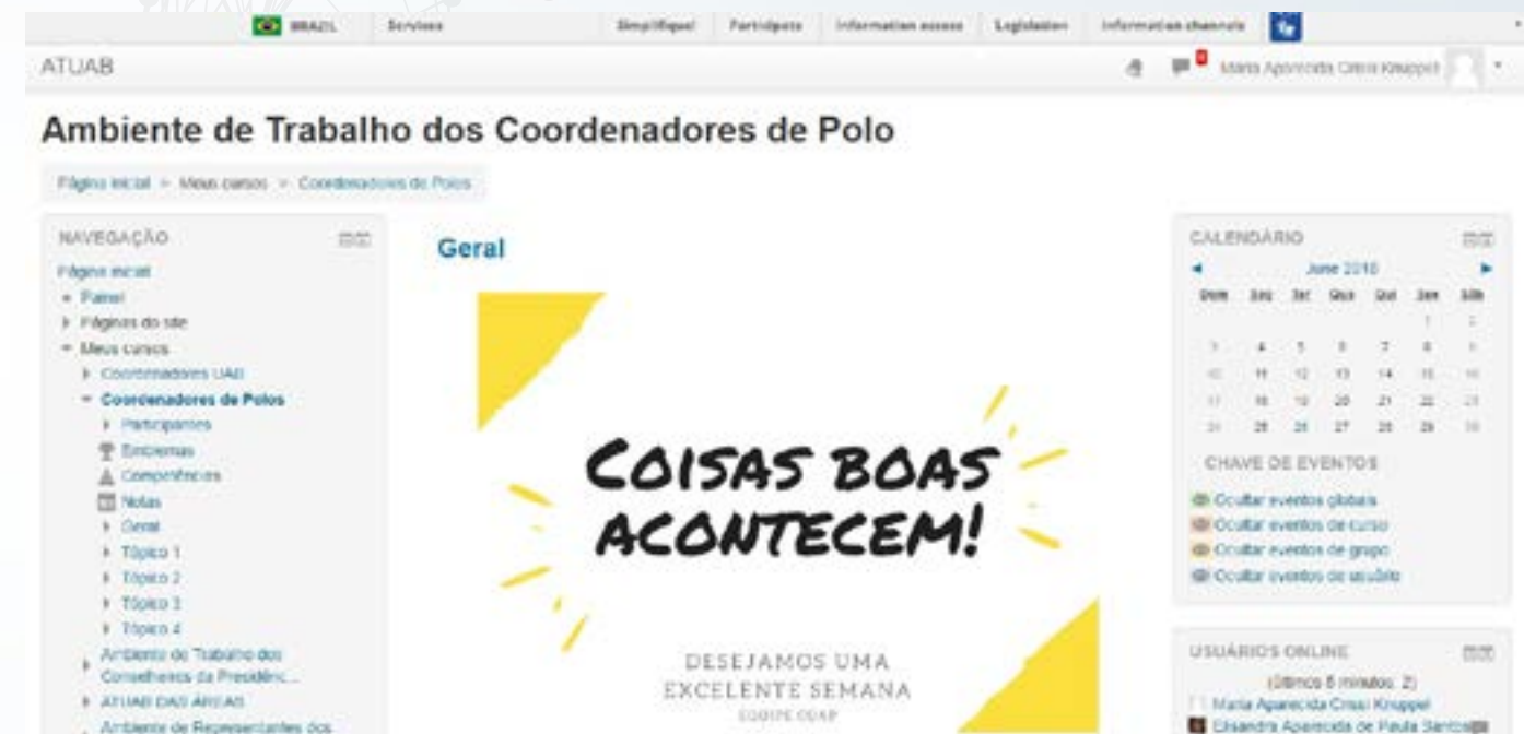
Imagem 2: Página inicial do Ambiente dos Coordenadores de Polo

Ao clicar no ícone Ambiente de Trabalho dos Coordenadores de Polo , você terá acesso a página de interação do seu grupo. Fique à vontade para navegar e aprender mais sobre o Sistema.