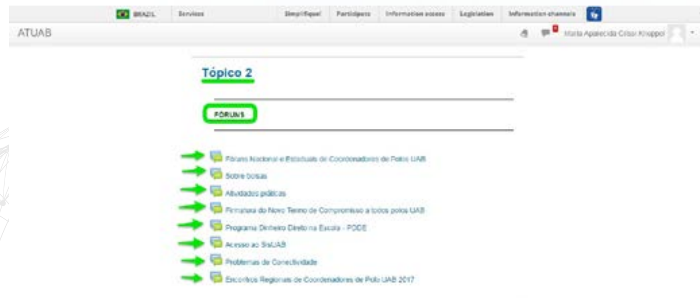
Imagem 8: Fóruns

Vejam alguns fóruns importantes para se manterem informados sobre as principais atividades e ações da Diretoria de Educação a Distância.