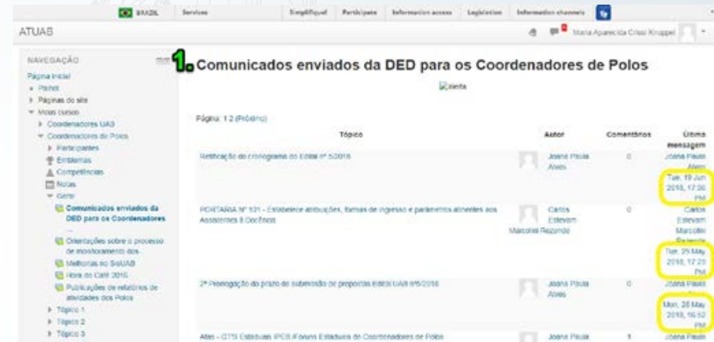
Imagem 4: Comunicados enviados da DED para os Coordenadores de Polo

Vejam que é um espaço de recebimento de informações e não de interação. Portanto, não há a presença de mediadores.