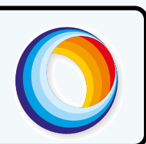
Imagem 1 - Alfabetização, letramento e a relação entre os dois processos