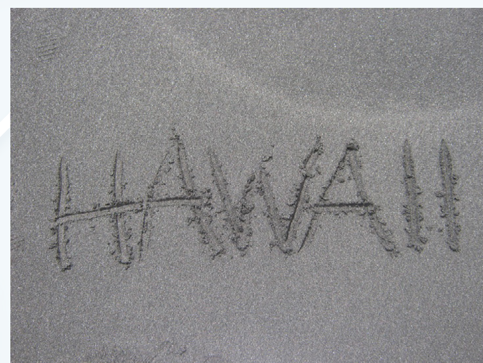
Imagem 3 - Escrita com areia

Traçar as letras na farinha de trigo ou areia: