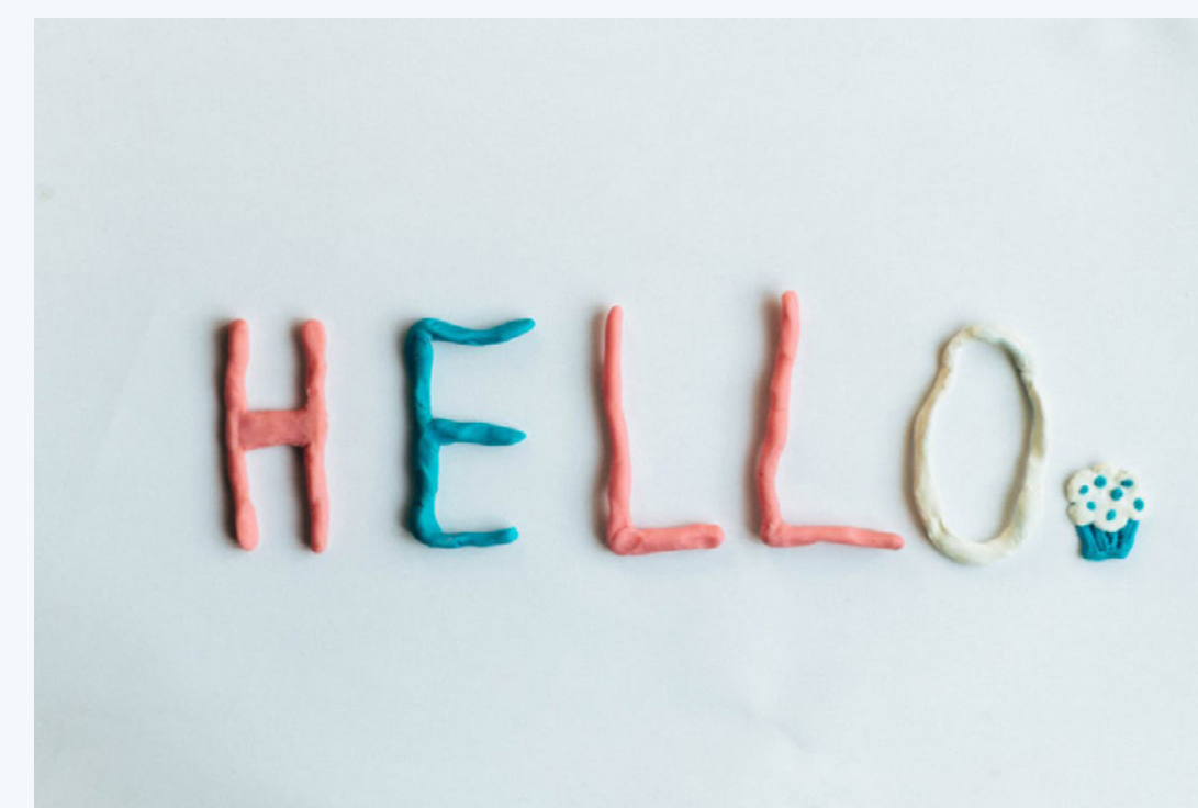
Imagem 4 - Escrita com massa de modelar