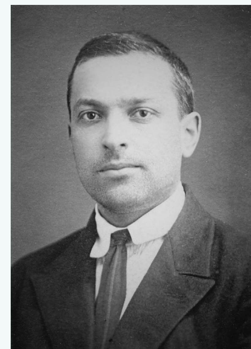
Figura 1 - Lev. Vigotski

Durante este material serão utilizadas diversas grafias do nome de Vigotski, optou-se pela transliteração utilizada pelo autor consultado no trecho em questão